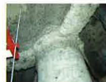
吹付けアスベスト （鉄骨材の耐火被覆）

建築基準法において規制対象とする吹付石綿等が施工されているおそれのある建築物に対しては、地方公共団体が調査および除去等の費用の一部を補助している場合があるので、お近くの地方公共団体にご相談ください。