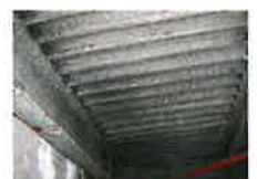
アスベスト含有吹付け ロックウール （鉄骨材の耐火被覆）